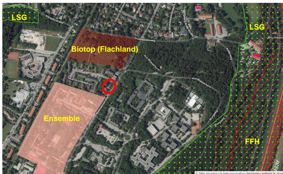
Abb. 1 Plangebiet, ohne Maßstab

Das Plangebiet befindet sich in zentraler Lage in Pullach entlang der „Heilmannstraße“/ Ecke „Am Grundelberg“. Es ist ca. 0,21 ha groß und weitgehend eben.