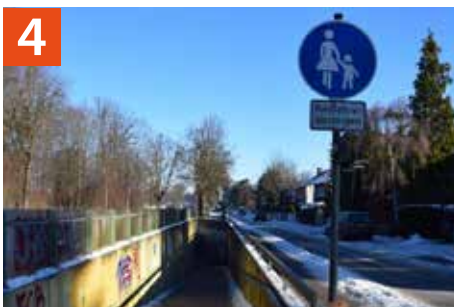
Unterführung unter der B 11 in Verlängerung der Pater-Rupert-Mayer-Straße