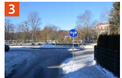
Kreuzung Pater-Rupert-Mayer-Straße / Wolfratshausen-Straße