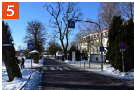
Zebrastrifen vor dem Schulgebäude