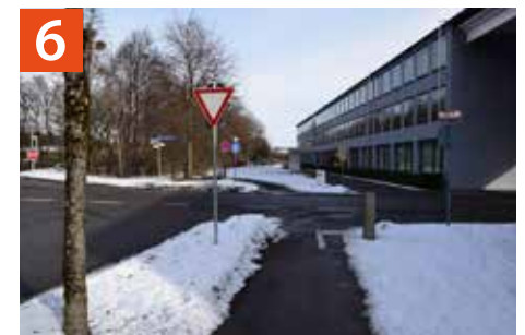
Kreuzung Pater-Augustin-Rösch-Straße und Wolfratshausen-Straße