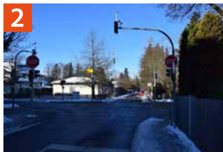
Kreuzung Pater-Rupert-Mayer-Straße / Richard-Wagner-Straße